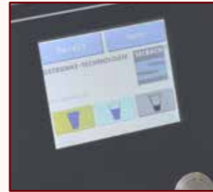
3 Getränke in 3 verschiedenen Portionen

Dürfen es 0,2 - 0,3 oder 0,4 Liter Glühwein sein? Oder ein Kakao mit immer gleichem Amaretto-Schuss? Bis zu drei Getränke in jeweils drei unterschiedlichen Portionen lassen sich mit dem HOTSHOT-Portionierer programmieren. Neben unterschiedlichen Getränkegrößen (klein, mittel, groß bzw. Kinderportionen o. ä.) lässt sich damit sicherstellen, dass genau so viel im Becher ankommt, wie gewünscht ist. Zusätzlich lassen sich sogar Zapfpausen programmieren.