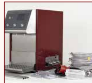
Im Paket: alles für den perfekten Anschluss

Die hohe Leistung schlägt sich darin nieder, dass der HOTSHOT-Portionierer innerhalb von ca. 5 Minuten betriebsbereit ist und bis zu 100 Liter pro Stunde problemlos heiß gezapft werden können. So wird es jedem Kunden warm um's Herz, während durchgehend in unterschiedlichen Portionen weitergezapft werden kann.