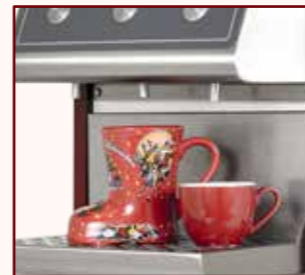
Höhenverstellbare Tropfschale: unterschiedlich große Gefäße können befüllt werden

Die Temperatur wird beim HOTSHOT-Portionierer mit einem Prozessor elektronisch gesteuert. Die Erwärmung der Getränke erfolgt gleichmäßig und schonend. Im „Stand by-Betrieb“ wird die Temperatur beibehalten; die Heizung schaltet sich bedarfsgerecht an und aus. Damit das Getränk bei optimalem Stromverbrauch jederzeit optimal temperiert ist.