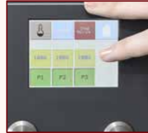
Über das Menü sind viele Einstellungen möglich

Bediener können beim HOTSHOT-Heißgetränke-Portionierer auf dem Touchscreen die Portionsgrößen einstellen und im Notfall den Zapfvorgang unterbrechen. Zusätzlich kann der Betreiber über einen codierten Zugang weitere Einstellungen vornehmen: Pumpen können ein- und ausgeschaltet, die Pumpengeschwindigkeit zwischen 30 und 100% geregelt sowie die Portionsgrößen eingestellt werden. Falls gewünscht, können Daten abgefragt werden – u. a. auch die Anzahl der gezapften Portionen.