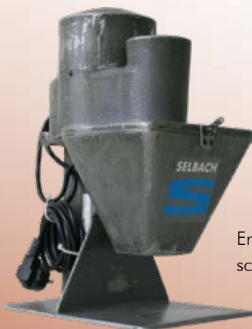
Erster Currywurstschneider 1963.